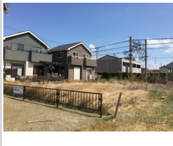
写真 フェンスより奥が対象物件敷地です。